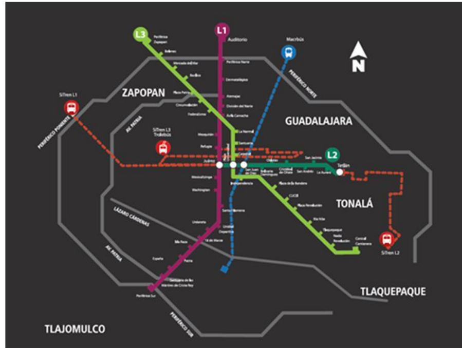
Ilustración 1. Red SITEUR actualizada. Elaborada por la Gerencia de Comunicación de SITEUR (2016).

SITEUR conforma la red con mayor cantidad de kilómetros con 111.8 km que interconectan al usuario a los principales puntos o referentes de la ZMG; integrado por el Tren Eléctrico y sus Rutas Alimentadoras del SITREN.